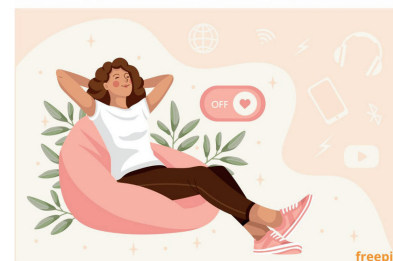
Atelier animé par Geneviève